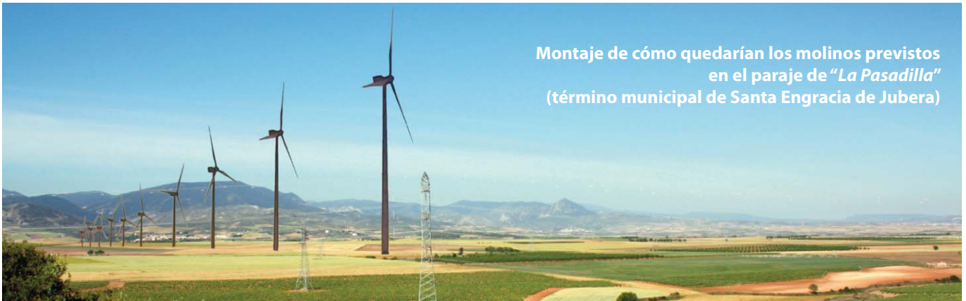
Montaje de cómo quedarían los molinos previstos en el paraje de "La Pasadilla" (término municipal de Santa Engracia de Juberá)

En los últimos meses se han conocido varios proyectos de parques de energías renovables, lo que ha suscitado la oposición de agricultores y vecinos de las localidades afectadas. En la Unión consideramos que la necesaria apuesta por formas más sostenibles de generación de energía no han de hacerse a costa de afectar al territorio, especialmente al agrario.