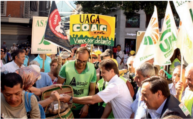
Los máximos dirigentes de las OPA iniciaron el reparto

El viernes 5 de septiembre agricultores de toda España repartieron 10 toneladas de frutas en la Plaza Callao de Madrid. Convocados por todas las organizaciones, mostramos nuestra indignación por el veto de Rusia y exigimos medidas extraordinarias a los ministros de Agricultura de la Unión Europea, que en esos momentos estaban reunidos en Bruselas.