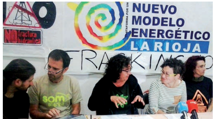
Rueda de prensa de la Plataforma el 30 de julio

Dice el sentido común que "general y desproporcionado" es el daño que genera la extracción por medio de fracking, no potencialmente sino de forma real. Los estudios y la larga experiencia en otros países como Estados Unidos demuestran que el gas se agota pronto, que cada vez hay que perforar más pozos y más profundos y que, con todas las medidas de seguridad y precauciones en marcha, los accidentes se suceden y los cultivos, los animales, las personas y el medio ambiente, especialmente los acuíferos, se ven muy afectados . El gas se acaba pronto y quedan la contaminación y la devastación.