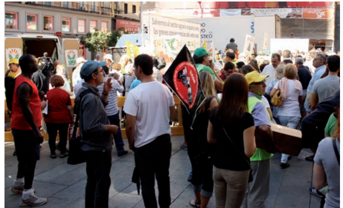
Miembros de la UAGR durante el reparto