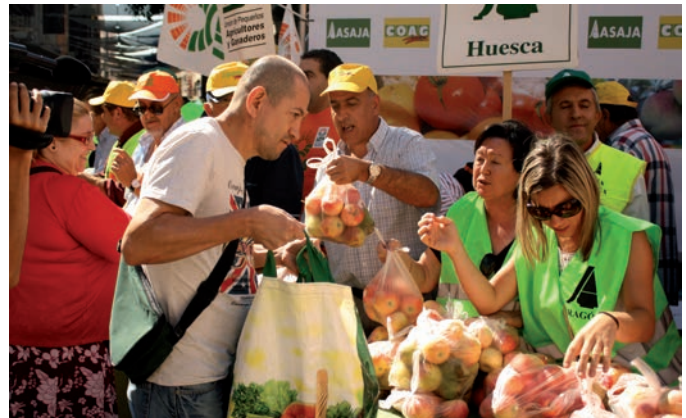
Dos momentos del reparto