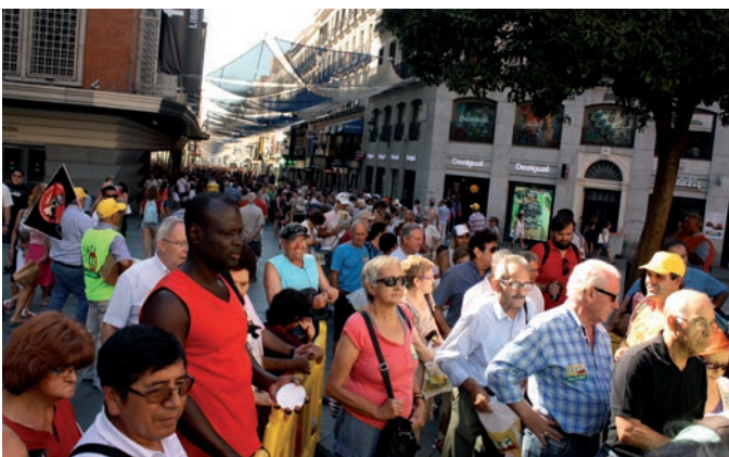
Cientos de ciudadanos madrileños se acercaron hasta Callao