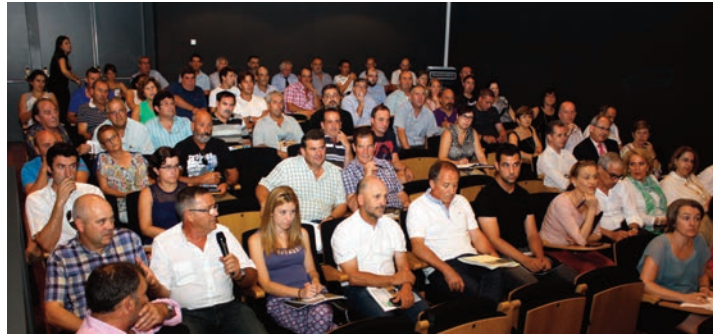
Dos momentos del debate entre los asistentes

Durante el debate destacó la opinión de varios agricultores criticando la mayor carencia de esta Ley, la ausencia total de regulación de la