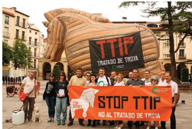
El caballo de Troya contra el TTIP está recorriendo España para denunciar el Tratado. Pasó por Logroño el pasado 15 de junio.

¿También desean los ciudadanos europeos que nuestras producciones de calidad diferenciada con Denominaciones de Origen, Indicaciones Geográficas Protegidas, Etiquetas de Calidad y otras figuras, no sean reconocidas por EEUU y no se respeten sus códigos de calidad, sus normas y sus denominaciones en aquellos mercados, pudiendo fusilarlos a través de simples marcas sin condiciones, ni garantías?