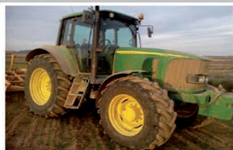
JOHN DEERE 6920