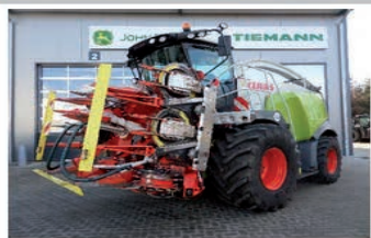
CLAAS 940 SIN CABEZAL