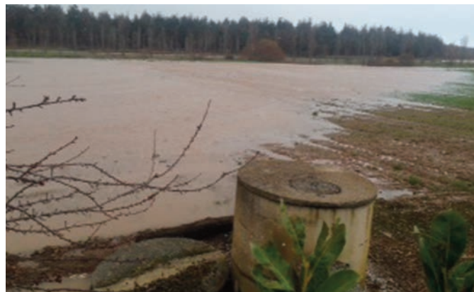
Imagen del desbordamiento del Oja en 2015

En concreto, desde la UAGR solicitamos una intervención inmediata para reparar las defensas del río Oja a su paso por las localidades de Santo Domingo de la Calzada y Santurde de Rioja. Esta urgencia en la reparación para devolver al río a su cauce original está motivada por los graves daños que varios agricultores han vuelto a sufrir este mes de enero, inundaciones y arrastre de tierras que se vienen repitiendo con cada crecida del Oja durante los últimos años.