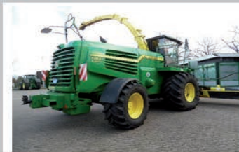
JOHN DEERE 7780I SIN CABEZAL