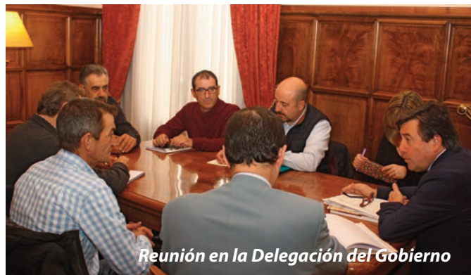
Reunión en la Delegación del Gobierno

Este año de nuevo los agricultores se encontraban los árboles pelados cuando acudían a las fincas. Por este motivo solicitamos sendas reuniones a la Delegación del Gobierno y a la Consejería de Agricultura. Con el delegado del Gobierno la reunión tuvo lugar el pasado día 12 de noviembre. Al día siguiente se hizo pública la detención de un ciudadano residente en Calahorra al que se le acusa de haber vendido de 11.026 kilos de almendras sin haber justificado su procedencia. Además, en el momento de la detención se disponía a entregar otros mil kilos con la misma procedencia desconocida. Según la Guardia Civil, este hombre acoplaba un vibrador con paraguas al tractor que había alquilado previamente.