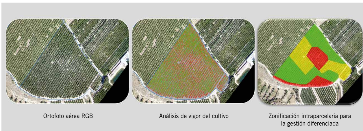
Figura 1. Imágenes de dron para la zonificación de una parcela. / Drónica

de distintos actores: agricultores, ganaderos, investigadores, empresas agroalimentarias, cooperativas agrarias, empresas tecnológicas, entidades públicas, para trabajar en común. En la página web de la Consejería de Agricultura se pueden consultar los proyectos aprobados.