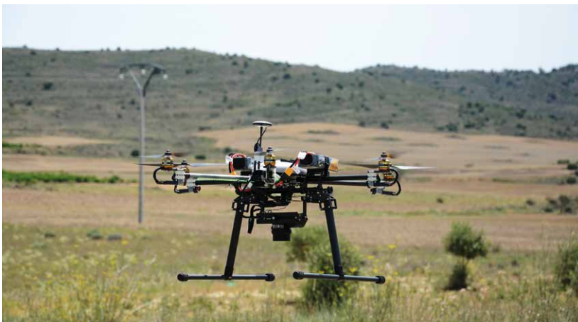
Vuelo de dron sobre olivares de la zona de Grávalos.