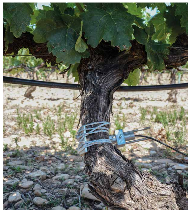
Sensor en viña.

bles meteorológicas, permite saber qué riesgo existe en cada momento de ataque de alguna enfermedad. En concreto, esta empresa ofrece pronósticos de infección de mildiu, oídio y botrytis en la vid y moteado en manzano y en peral. El agricultor o el técnico reciben la información en su ordenador o en su móvil ya procesada y de una forma muy sencilla y gráfica (ver figura 2 para riesgo de oídio).