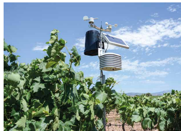
Estación agroclimática en la finca de Bodegas Campo Viejo.

Este grupo operativo opta a las ayudas para desarrollar proyectos de innovación en el campo convocadas por el Ministerio de Agricultura y Pesca, Alimentación y Medio Ambiente (MAPAMA). También en La Rioja, dentro de las ayudas regionales contempladas en el Programa de Desarrollo Rural, se han constituido distintos grupos de trabajo con proyectos innovadores, algunos de ellos basados en la utilización de las nuevas tecnologías: para la extracción de aceite, la racionalización de riego o la predicción del oídio en vid, entre otros. Son proyectos que implican la actuación conjunta