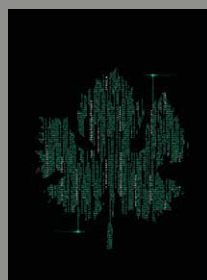
Ilustración de portada Sergio Aja. Calcco

Suscripción gratuita en: Consejería de Agricultura, Ganadería y Medio Ambiente Prado Viejo, 62 26071 Logroño Teléfono: 941 29 11 00. Ext. 33689 E-mail: cuadernodecampo@larioja.org www.larioja.org/agricultura