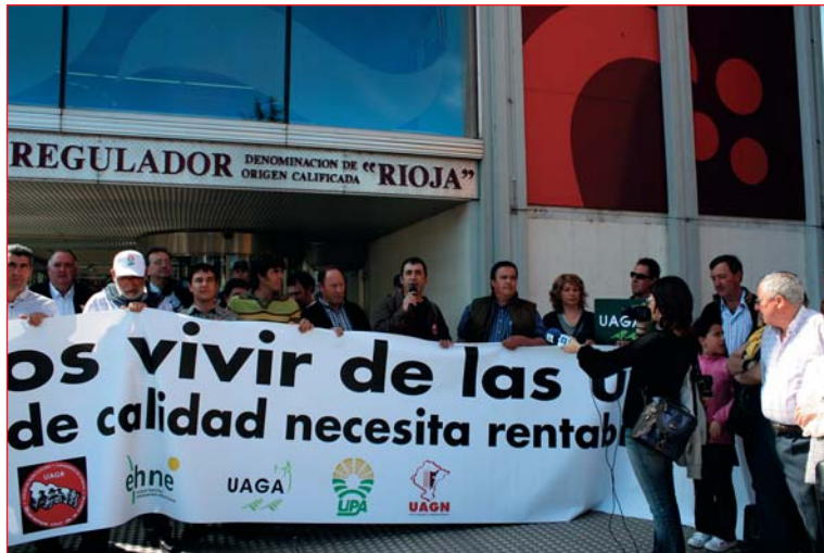
La manifestación comenzó a las puertas de la sede del Consejo y de la Interprofesional