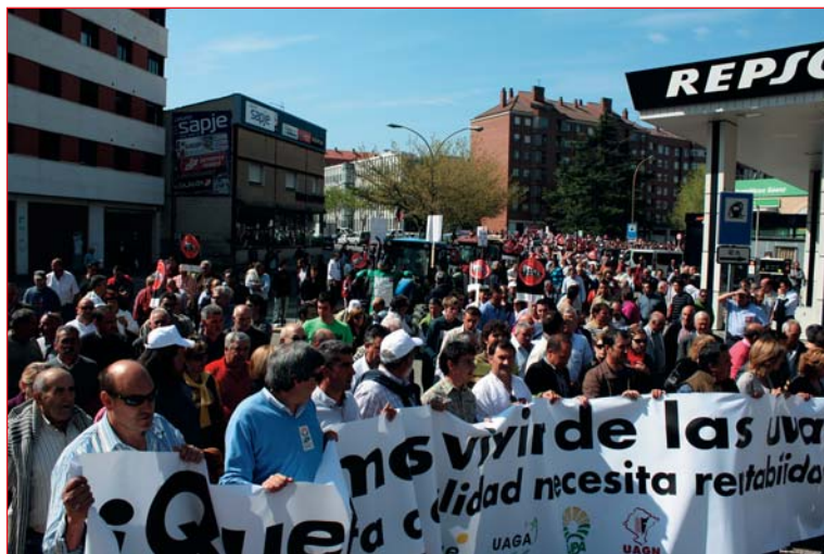
Tras las palabras iniciales, miles de viticultores iniciaron la marcha. La pancarta de cabecera tenía los siguientes lemas: "¡Queremos vivir de las uvas!" y "a viticultura de calidad necesita rentabilidad" .