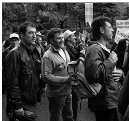
El presidente de la UAGR-COAG y el coordinador sindical, durante la manifestación