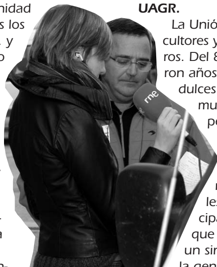
Intervención para toda España durante la última tractorada