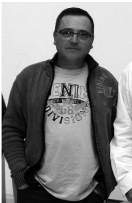
El día del Congreso Extraordinario de febrero de 2009

La evolución ha sido sencilla, y se explica porque en este país, y en esta región más, todo funciona por los votos. Entonces aquí la fórmula que se sacaron de la chistera los políticos fue crear masa vegetal, que era lo que le pedían las bode-