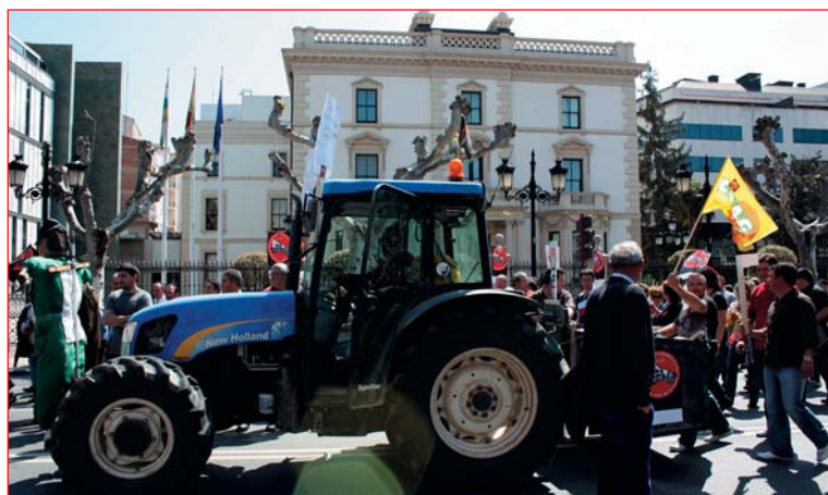
ensación", "Sanz y Pascual, lo vuestro huele al". "Ea, ea, ea, el campo se cabrea".