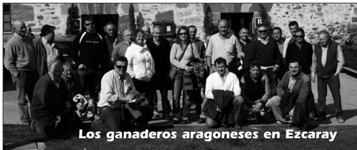
Los ganaderos aragoneses en Ezcaray

Aprovechando que iban de camino a Álava, un autobús de ganaderos socios de la cooperativa se detuvo en La