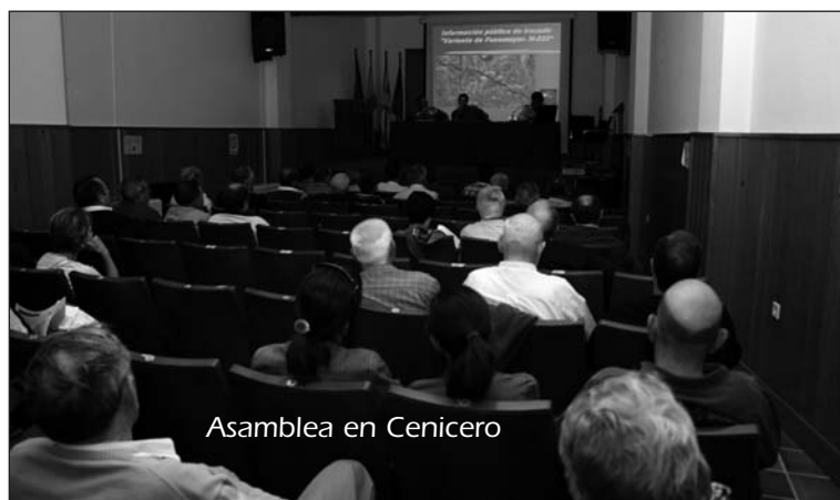
Asamblea en Cenicero

Ya en 2010, con varios partidos y asociaciones, la UAGR participa activamente en la Plataforma pro rescate de la AP-68. Representantes de la Plataforma ya nos