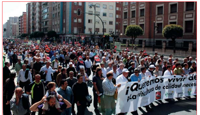
Durante la marcha, alguno de los cánticos de los manifestantes fueron: "No a la reducción sin com-