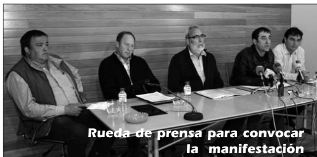
Rueda de prensa para convocar la manifestación

Todo nuestro trabajo no hubiera conseguido el éxito deseado si los viticultores no llevaran el cabreo encima. Un cabreo provocado claramente por la pretensión de las bodegas de que la crisis la paguemos los viticultores.