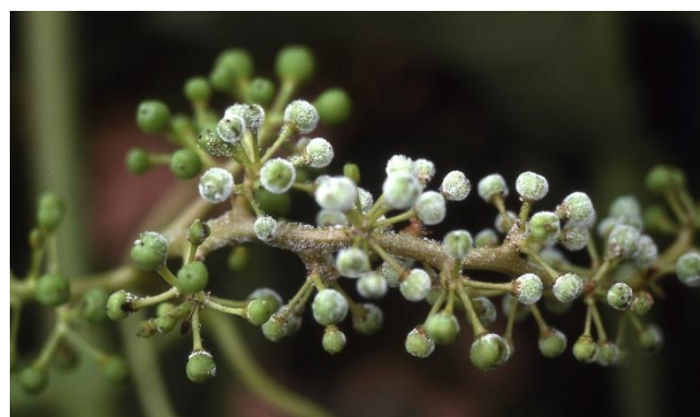
Fructificación de mildiu en racimo.