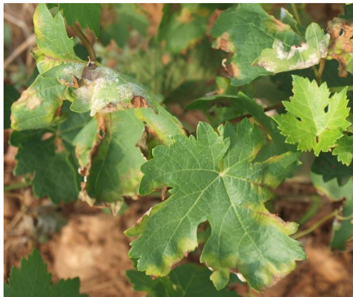
Manchas de aceite en el haz y fructificaciones en el envés de las hojas.

(1) Se recomienda usar en mezcla con otros productos penetrantes, de fijación a ceras o de contacto.