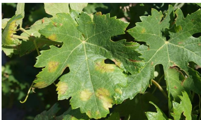
Manchas de aceite en el haz de la hoja.

Una vez vistas las manchas comunicarlo a la Sección de Protección de Cultivos para la inmediata comprobación por personal técnico. No arrancar la hoja o racimo atacado. En caso de que la mancha no esté fructificada se llevará al laboratorio para su comprobación.