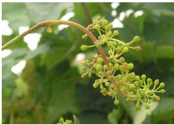
Curvatura en "S" del racimo y oscurecimiento del raquis.

(2) No mezclar el azoxitrobin con productos formulados en EC (Emulsión Concentrada).